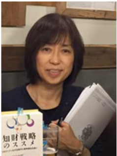
中小企業診断士 税理士