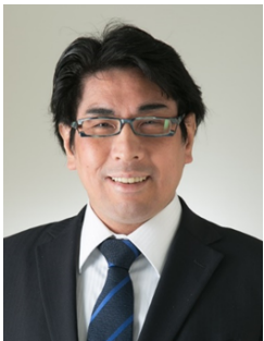
中小企業診断士 価値創造コンサルタント